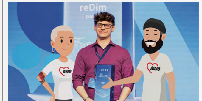
Ein Agenturmitarbeiter hat den Preis bei der Verleihung entgegengenommen. Auch die AWO-People waren dabei – als Avatare.